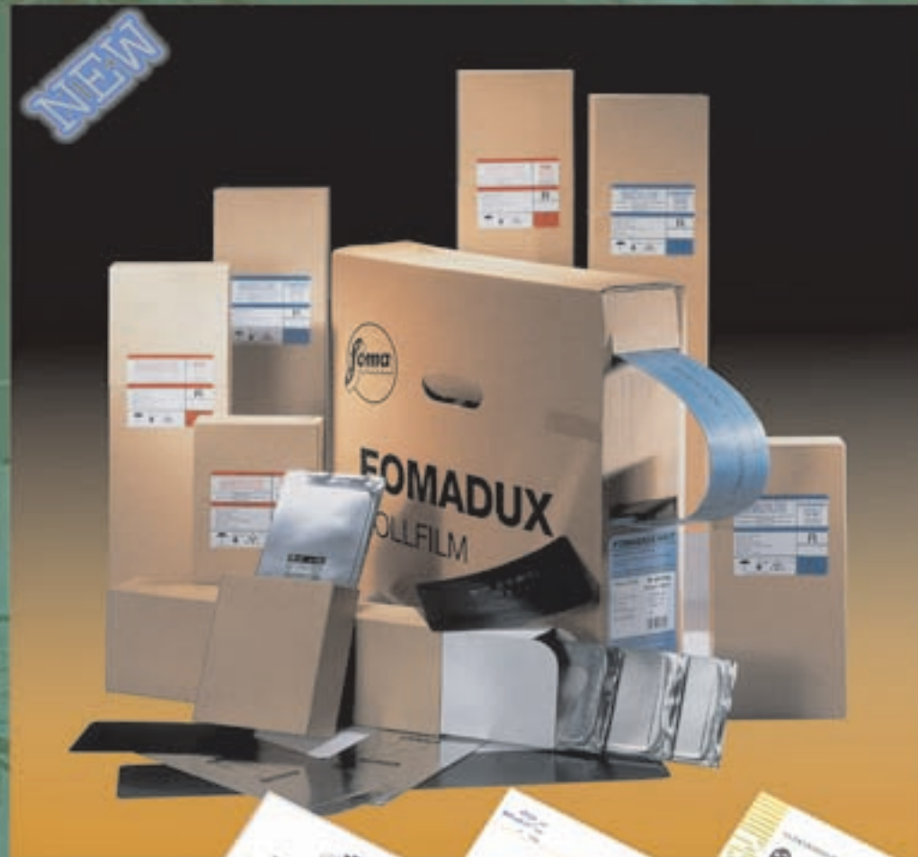
Foma New Type

(( ثبت در بانک اطلاعات اداره بررسی منابع و تحقیقات بازرگانی و پیمانکاری شرکت ملی گاز ایران ))